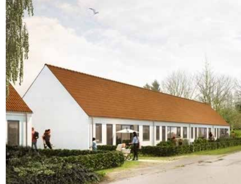
Sådan kommer de nye lejligheder i Føns til at se ud.

I 2020 var det så Føns' tur. Coronapandemien forsinkede processen noget, men det lykkes dog at få nedsat en udviklingsgruppe, hvor alle relevante kræfter i Føns var repræsenteret, og 1. september 2021 kunne det første borgermøde afholdes i den Gamle Skole. Med vanlig sprudlende entusiasme kastede fønserne sig ud i opgaven, og inden aftenen var omme, havde der udkrystalliseret sig 6 indsatsområder hver med sin arbejdsgruppe, hvor det ene blev kaldt »Livsfaseboliger«. Arbejdsgruppen for dette indsatsområde gik til opgaven med krum hals, fik defineret de kommende boligers størrelse og indretning, fik identificeret mulige byggefelter, fik snakket med lodsejere, ejendomsmægler, kommunens forvaltning og Lokaludvalget. Af de mange muligheder var den grund, hvorpå den gamle brugs ligger, mere oplagt end de andre. Byggefeltet ligger lige op til de eksisterende almennyttige boliger, det ligger lige i Føns »City«, hvorfra der er kort afstand til landsbyens centrum, Føns Gl. Skole.