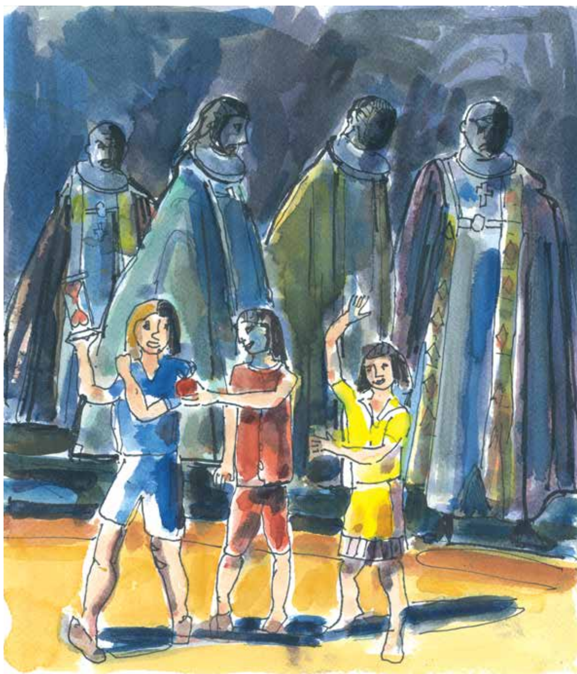
Akvarel af Allan Herrik februar 2023