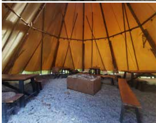
Naturskolens store tipi.

Skt. Hans er også et arrangement de gerne vil stå for, hvor alle er velkomne.