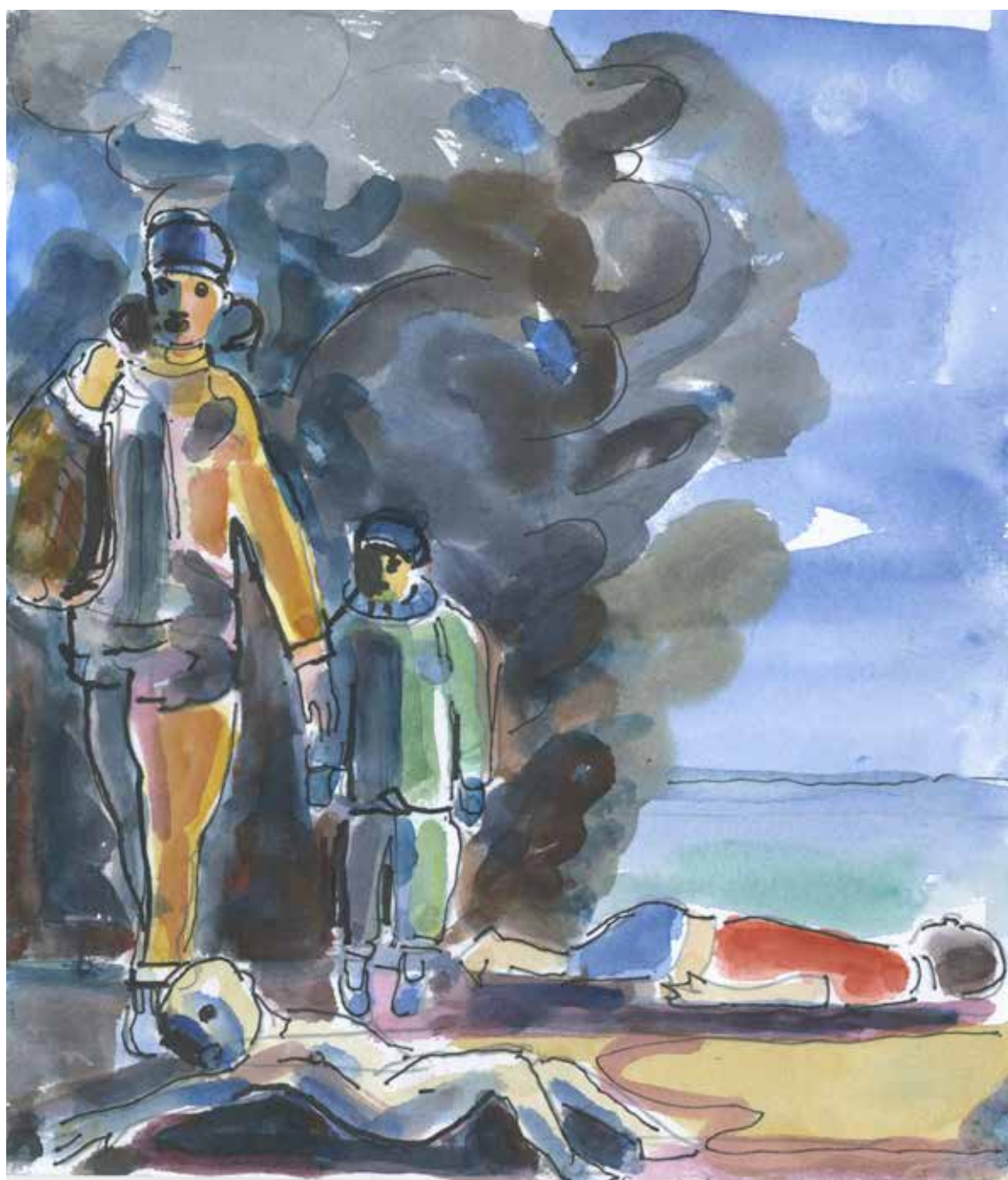
Akvarel af Allan Herrik juni 2022